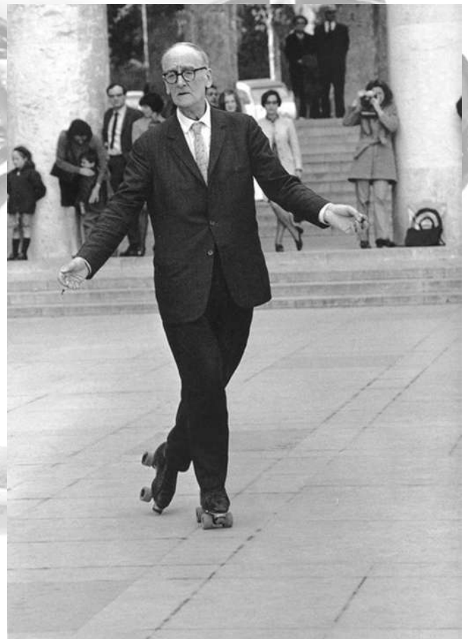
Robert Doisneau - patineur solitaire - 1969

Nous nous proposons d'imaginer la suite : le lendemain, John, encore entravé et handicapé par sa chute, voit à nouveau apparaître son double, son fantôme, qui vient le hanter, raviver cet émerveillement fugace d'un sentiment de liberté jamais ressenti jusqu'alors.